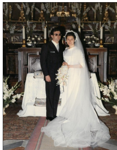
6 settembre 1969